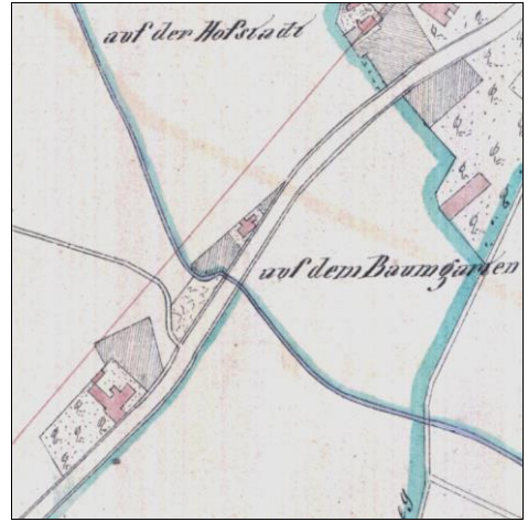
Abb. 3: Hagfeldhof, 1837/1838

Vergleicht man die Karten von 1787 (Abb. 1) und 1804 (Abb. 2), so lässt sich erkennen, dass aus den zwei Gebäuden im Jahr 1787 17 Jahre später zumindest ein großes Gebäude geworden war. Vor 1838 wurden die Hofgebäude des Hagfeldhofs noch einmal erweitert (siehe Abb. 3). Dieser Gebäudezustand war 30 Jahre später, 1869, nahezu unverändert noch vorhanden.