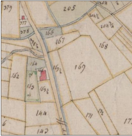
Abb. 2: Hagfeldhof, 1804 (Nr. 163 und 163 ½ ( Baumhoff und Land ), 164 ( Garten ), 165 ( Hauß und Hoff ) sowie die Ackergrundstücke 168 und 172)