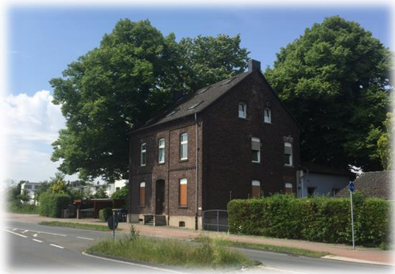
Hagfeldhof & Hesinde's Haus